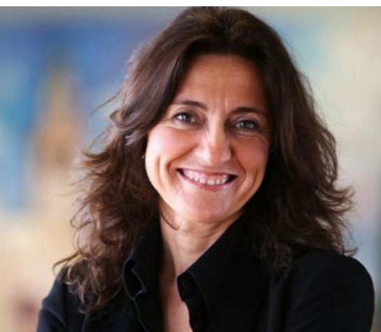
Mercè Conesa Presidenta del Port de Barcelona

En esta Memoria 2019 queremos hacer patente que el Port de Barcelona en su conjunto, liderado desde la Autoridad Portuaria, tiene alineadas sus estrategias con los Objetivos de la Agenda 2030 establecidos por la Organización de las Naciones Unidas (ONU). Asumimos nuestro compromiso con los Objetivos de Desarrollo Sostenible (ODS) llevando a cabo una serie de acciones, recogidas en esta publicación, para favorecer el surgimiento de una economía y una forma de vida más igualitarias, inclusivas y sostenibles.