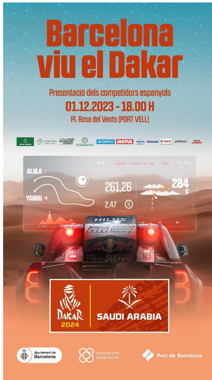
FOTO: Cartel promocional del acto de presentación de los equipos españoles en el Dakar 2024.