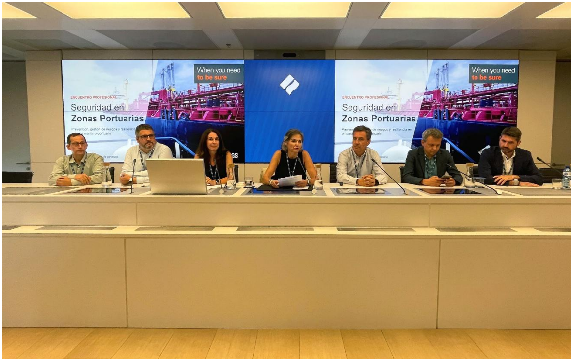
FOTO. Los ponentes de la jornada "Seguridad y Resiliencia en instalaciones portuarias ante los riesgos operativos y emergentes".