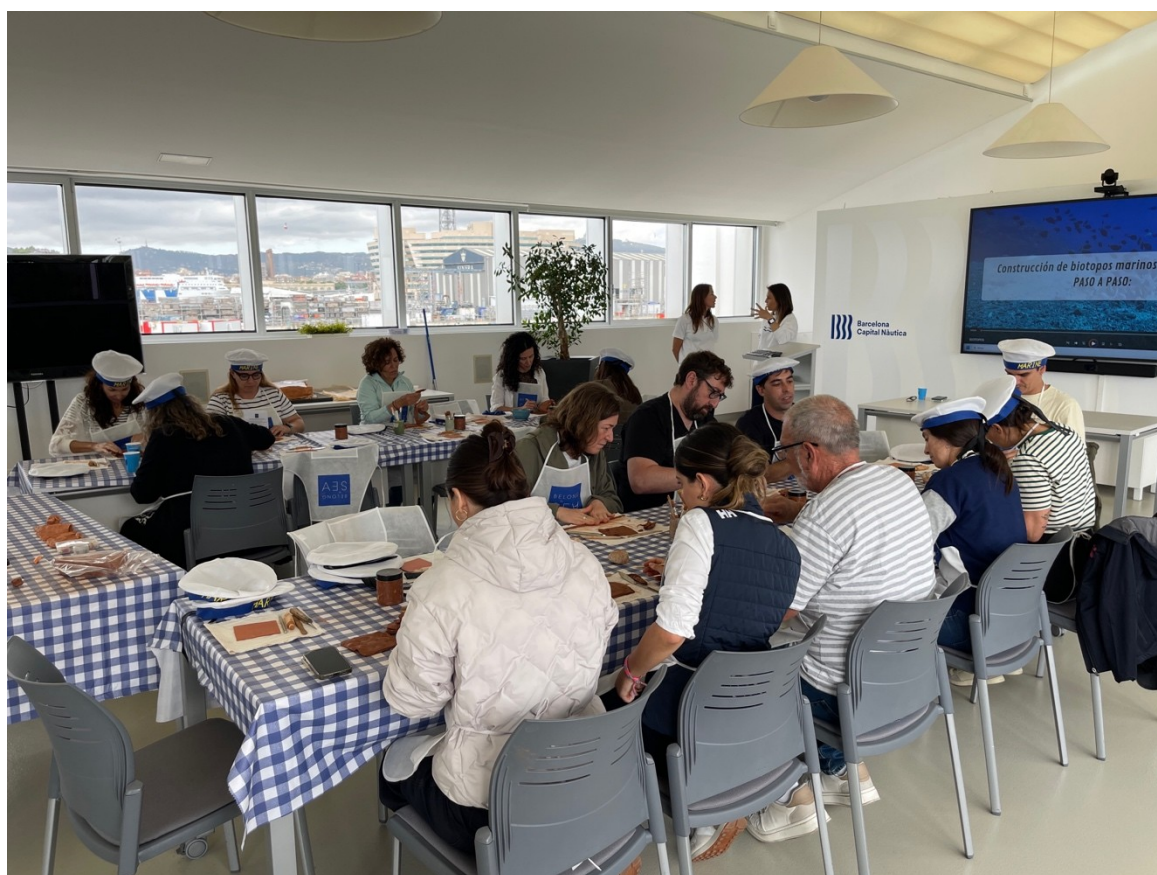
FOTO. La actividad ha combinado una salida en velero con un taller de creación de biótopos marinos.