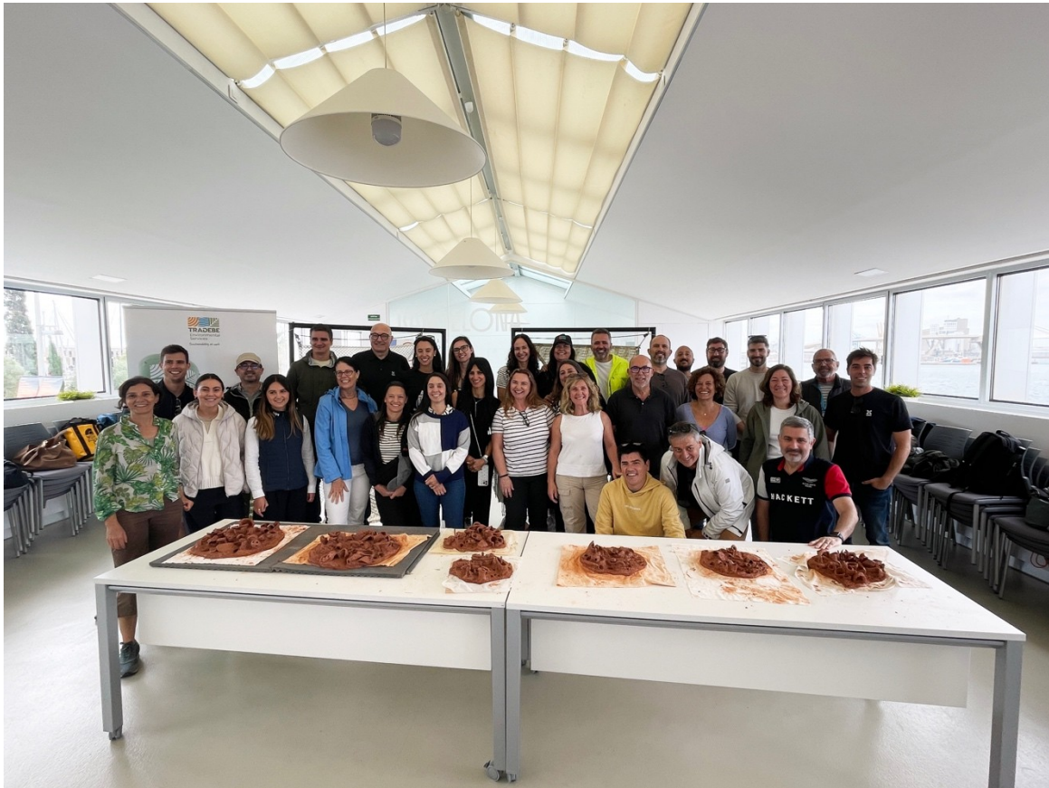
FOTO. La iniciativa ha sido impulsada por el grupo de trabajo de Medio Ambiente del Consejo Rector de la Comunidad Portuaria de Barcelona y ha contado con la participación activa de 21 empresas del sector logístico y portuario.