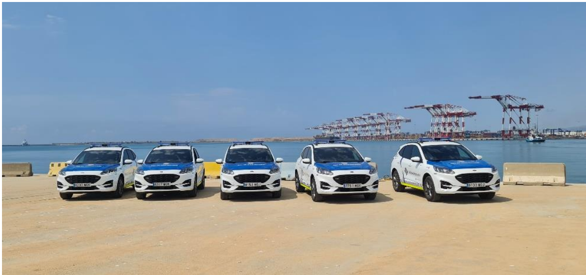
FOTO: Los nuevos vehículos permitirán reducir de forma importante el impacto ambiental en el patrullaje.