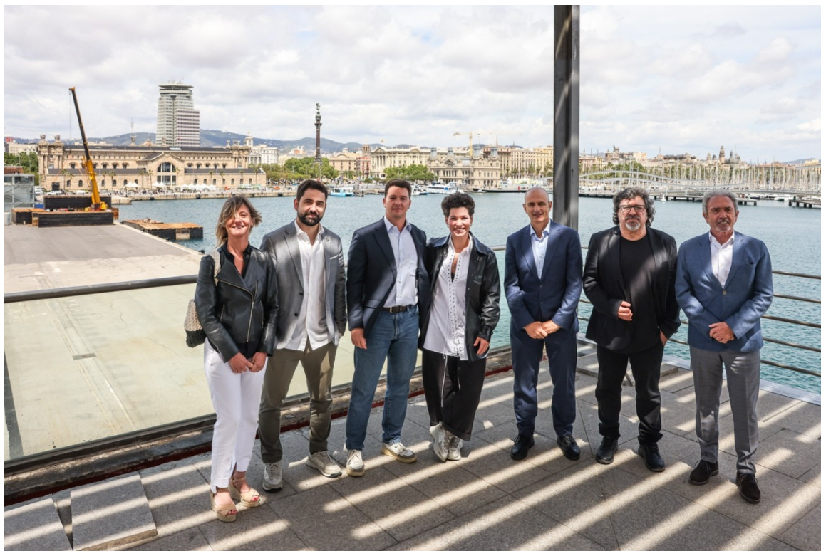
FOTO. Representants del Port de Barcelona i de l'organització del festival Blaumarí Port Vell.

Amb aquesta primera presentació, Blaumarí Music comença a dibuixar una experiència que va més enllà de la música en directe, integrant cultura, gastronomia i entorn en una proposta única a Barcelona.