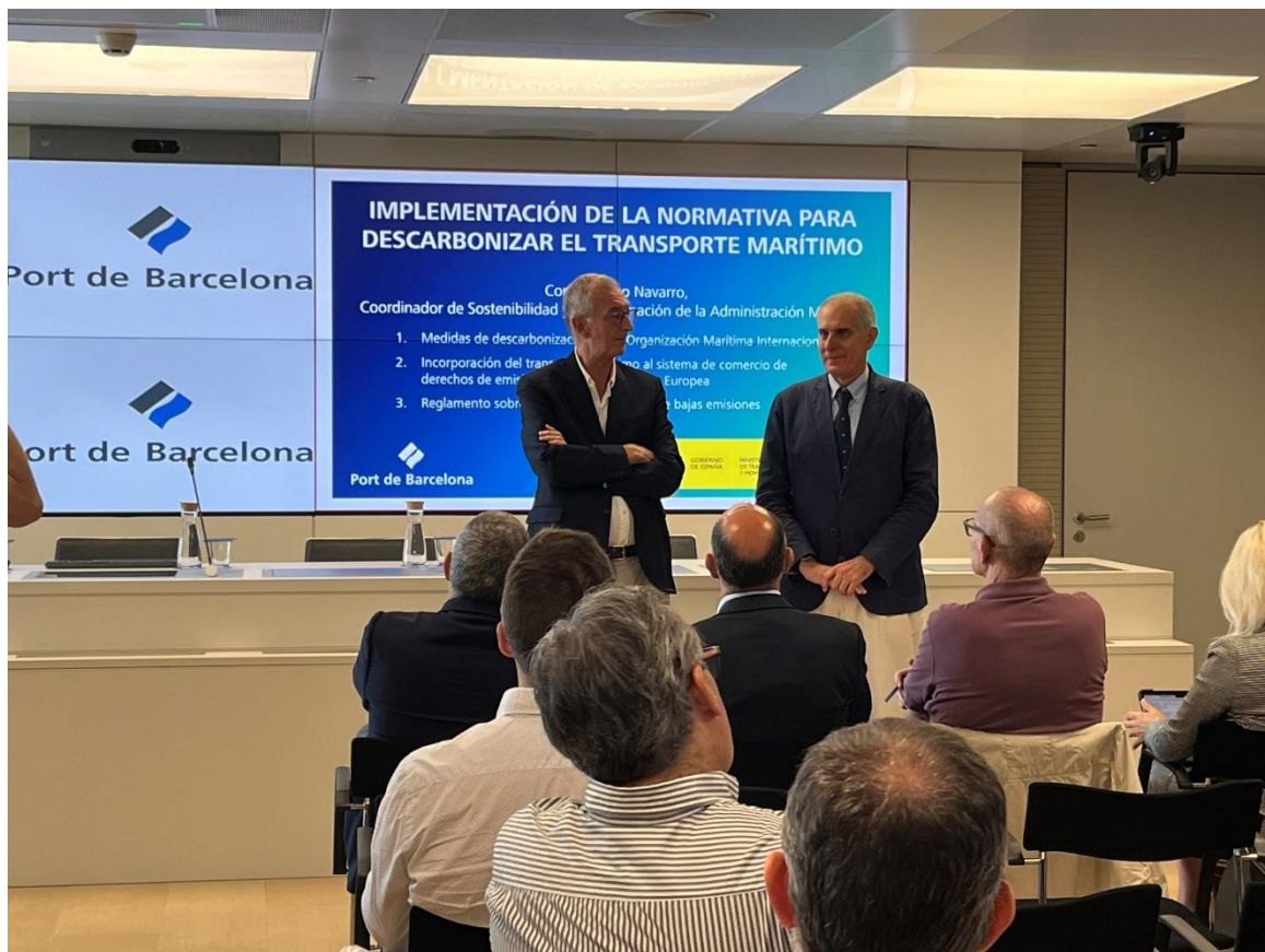
FOTO: Adjuntem fotografies de la jornada.

Tampoc no ha obviat que un dels possibles impactes de la incorporació del transport marítim al sistema de comerç de drets d'emissions és la desviació del tràfic marítim a altres ports no comunitaris. En aquest sentit, l'Estat espanyol va liderar una declaració, avalada per 10 països de la UE, per instar a avaluar l'impacte d'aquesta mesura en el trànsit marítim.