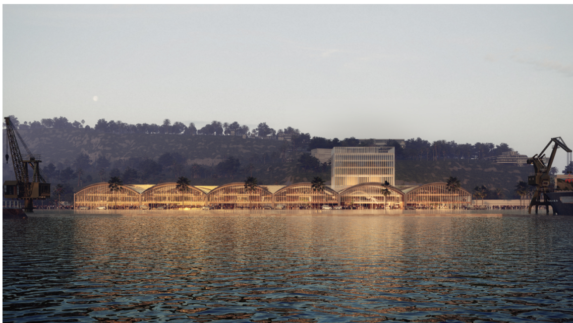
FOTO. Imatges del futur BlueTechPort als tinglados de Sant Bertran dissenyat per b720 Fermín Vázquez Arquitectes.

del Port Vell a la ciutadania, apostant alhora per la creació de nous espais públics i empreses i llocs de treball de qualitat”.