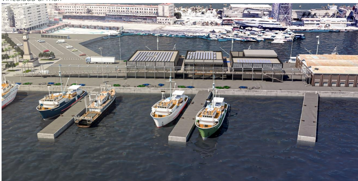
FOTO: La nova Llotja de Pescadors estarà oberta al públic, que podrà presenciar en directe la subhasta del peix, i comptarà amb un restaurant especialitzat en cuina mediterrània de qualitat vinculada al mar.