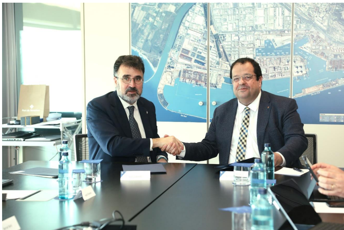
FOTO: El president del Port de Barcelona, Lluís Salvadó, i el conseller d'Interior, Joan Ignasi Elena, durant la signatura de l'acord.

L'objectiu és definir un model de seguretat del Port Vell–Port Ciutat que garanteixi que aquesta infraestructura, per on transiten a l'any més de 18 milions de persones i que rep força pressió d'aquelles problemàtiques que més afecten la ciutat, tingui cobertes les seves necessitats de prestació dels serveis públics de seguretat.